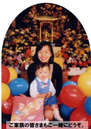
ご家族の皆さまも一緒にどうぞ。