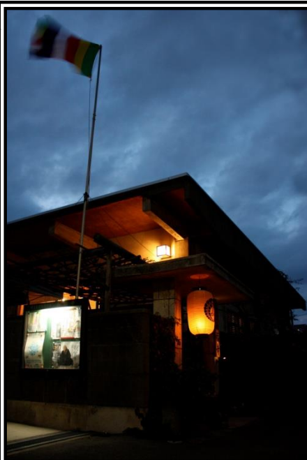
毎月28日、昼2時OPEN!ふっふかぴ。